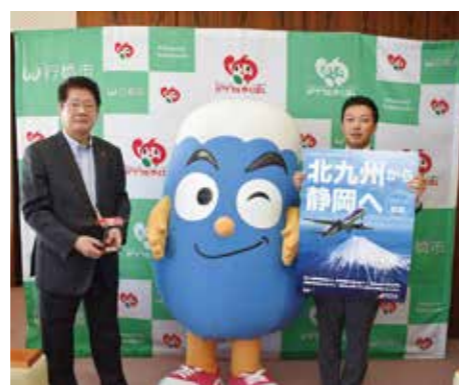
北九州→静岡便は18時発、静岡→北九州便は17時30分着

3月から北九州～静岡便を1往復運航しているフジドリームエアラインズの皆さんが市役所でPR活動を実施。静岡県のマスコット「ふじっぴー」とともに、県内の名所などを紹介し、利用を呼びかけました（右）。