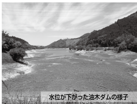
水位が下がった油木ダムの様子