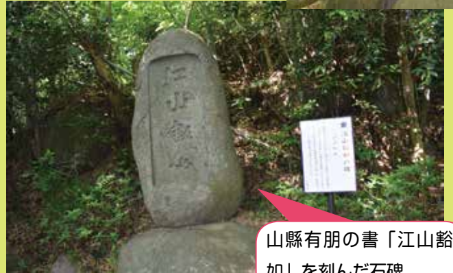
山縣有朋の書「江山豁如」を刻んだ石碑