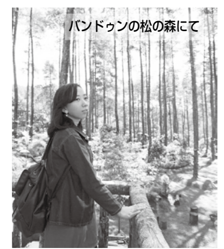
バンドゥンの松の森にて

I studied at university in Bandung and majored in Japanese language. I like reading manga and watching anime since I was little and I felt Japanese language and culture was so interesting. That was the reason I chose to learn Japanese. I've also learned English since elementary school, so I can speak English.