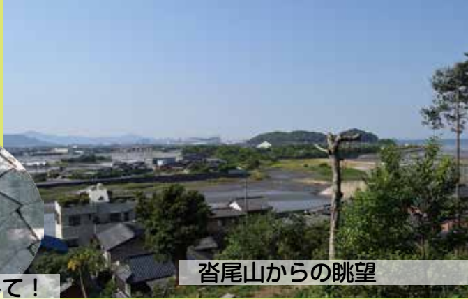
沓尾山からの眺望