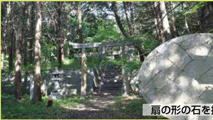
扇の形の石を探してみて！