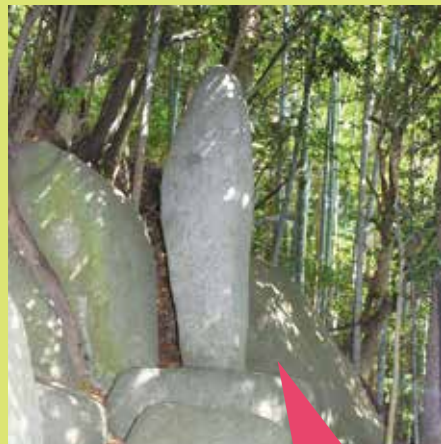
松尾芭蕉の句碑「名(明)月や門にさしくる潮頭」を刻んだ石碑