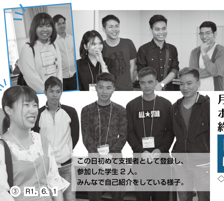
この日初めて支援者として登録し、参加した学生2人。みんなで自己紹介をしている様子。

就学や技能学習などさまざまな目的を持って日本に住む外国人の数は、年々増加しています。行橋市にも4月末現在、702人の外国人が住んでいます。国別ではベトナム190人、フィリピン122人、中国106人、韓国95人、インドネシア23人など。市報5月1日号で、外国人住民向けに「日本語教室 in ゆくはし KIZUNA」の皆さんの協力を得て住民異動届を記入する際の補足資料を作成したことを紹介しましたが、今後も外国人の居住者にとって、住みやすい環境作りが必要です。