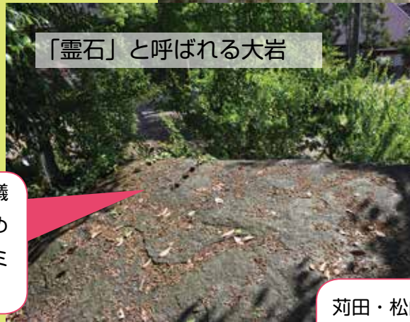
「靈石」と呼ばれる大岩