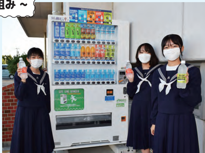
今年の夏は、何度もお世話になりました

部活動などに励む生徒たちの熱中症対策および災害対策として、市内すべての中学校に自動販売機が設置され、4月から8月までの5ヶ月間で約12,000本の利用がありました。この自動販売機は「LIFE LINE VENDER（緊急時開放備蓄型自販機）」といって、非常時には停電になっていても無償でドリンクを取り出せる仕組みになっています。生徒からは、「水筒が空になっても、すぐに補充ができるのですごく安心です」など、大変好評のようです。なお、リブリオ行橋にも災害対策用として設置されています。