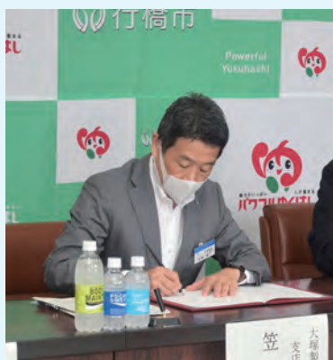
昨年7月の協定締結式