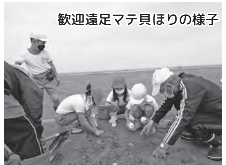
歓迎遠足マテ貝ほりの様子