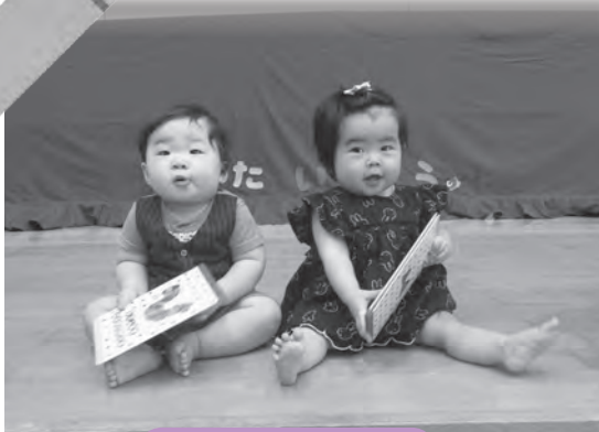
なかよし広場の誕生日会