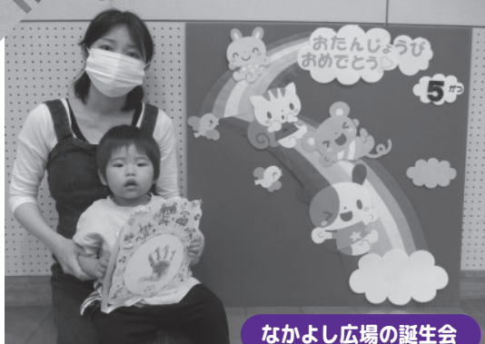
なかよし広場の誕生日会