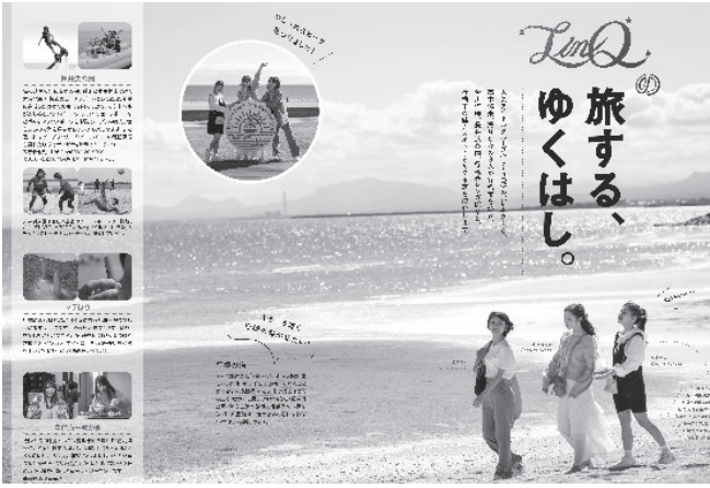
観光ガイドブック「旅する、ゆくはし」で広くPR！！

また、観光PRに關しましては、こちらも昨年度「行橋市観光振興基金」を活用して観光ガイドブック、「旅する、ゆくはし」を作製いたしました。今年度は、このガイドブックを活用し、福岡都市圏をはじめとした市外地域に對しまして積極的にPRを行い、更なる観光誘客につながる取り組みを実施してまいります。