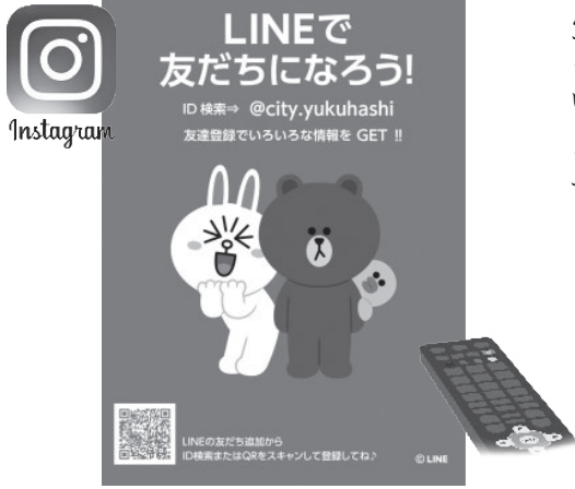
SNS・dボタンを活用したニーズに沿った情報発信

を確認して行動することや、手指衛生、マスクの着用など基本的な感染予防策の周知徹底を引き続き市民の皆様と呼び掛けてまいります。また、新型コロナウイルスワクチン接種におきましては、60歳以上の方や基礎疾患のある方などを対象に4回目の接種が始まっており、市民の皆様が安心して接種できるように、医療機関と連携し、接種体制の確保に努めてまいります。