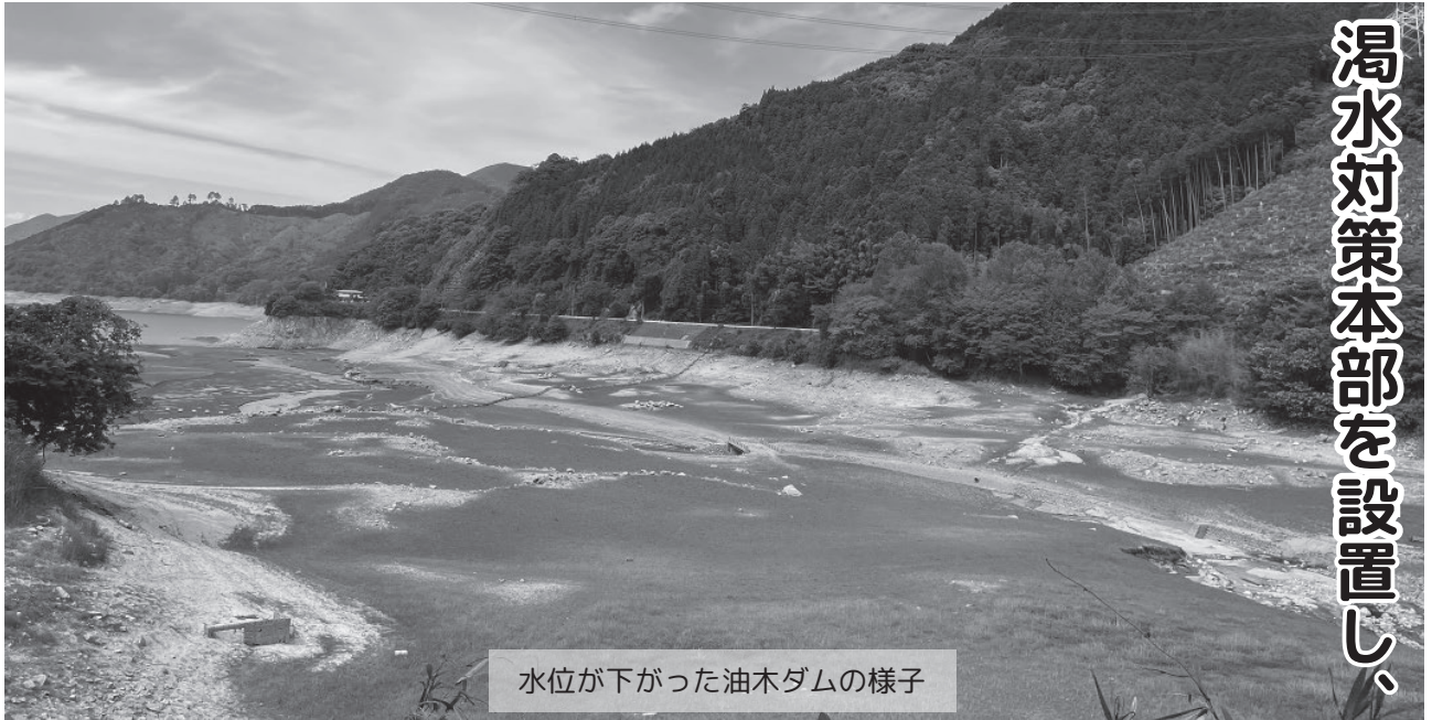
水位が下がった油木ダムの様子