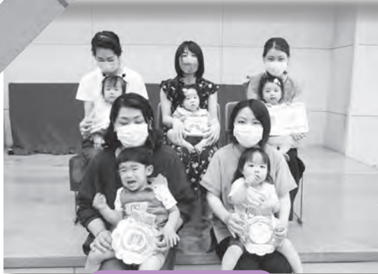
なかよし広場の誕生日会