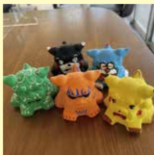
シーサー色塗り体験 【800円】