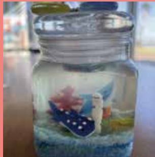
ジェルキャンドル 【1,000円】