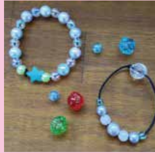
ビーズヘアゴム作り 【500円】