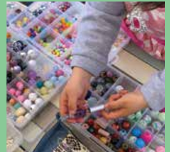
ビーズで作るオリジナル ボールペン【800円】