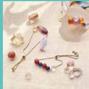
手染めビーズの ブレスレット【1,200円】