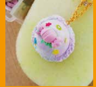
粘土で作るアイスの キーホルダー【800円】