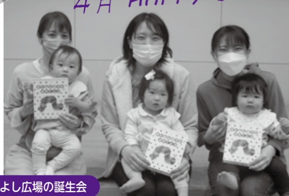
なかよし広場の誕生会