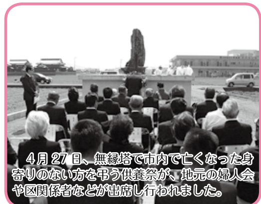
4月27日、無縁塔で市内で亡くなった身寄りのない方を弔う供養祭が、地元の婦人会や区関係者などが出席し行われました。

■先日友達と「シングリッシュ」について話しました。「シングリッシュ」はシンガポール人が日常生活で話している言葉です。「シングリッシュ」はイギリス英語・マレー語・タミル語に加え出身者が多い福建語・さらにテレビ等の影響によるアメリカ英語、オーストラリア英語の単語・文法構成に影響されているところが、多い特別な言葉です。シングリッシュの中によく使う言葉はたぶん「lah」と「leh」だと思います。それは文の語尾につけられて強調を表し、日本語でいう「～だよ」のようなニュアンスだそうです。友達に意味を何回も説明したけど、あまり理解してもらえませんでした。それは多分地元の方しか理解できないのかもしれないですね(笑)。(シエリル)