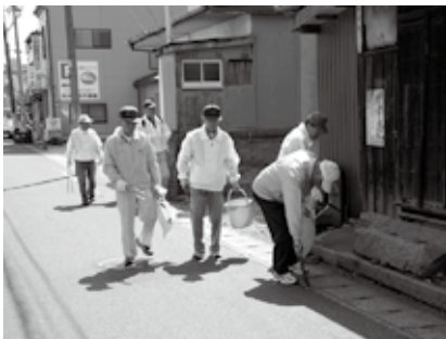
4月22日に行われた春季住み良い街づくり清掃キャンペーン。

サークルはボランティア、研修、親睦の3つの柱で活動しています。ボランティア活動では、毎年2回行橋駅の清掃、除草作業を実施したり中央公民館の花壇の植栽作業のお手伝い、また「地球環境について考える日」に合わせて駅前通りや市役所通りなど市街地のゴミ拾いを実施してきました。平成21年にはこれら