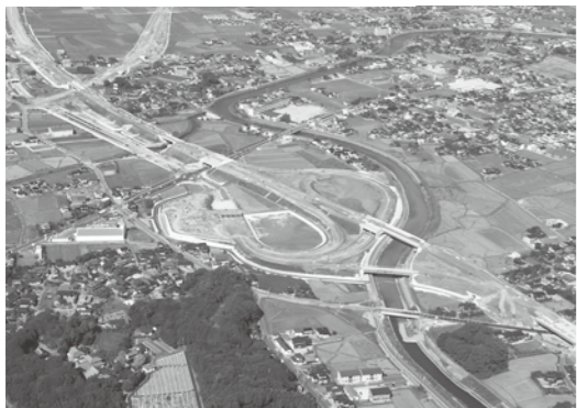
▲現在建設中の行橋IC 平成26年3月開通を予定し、開通を前に、ここを起点に記念マラソン大会が開催されます。