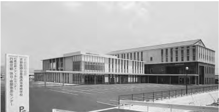
▲行橋京都メディカルセンター

東大橋のバイパス沿いに移転し、アクセスの向上に加え設備が増強された当センター。今後受け入れ態勢を強化していきます。