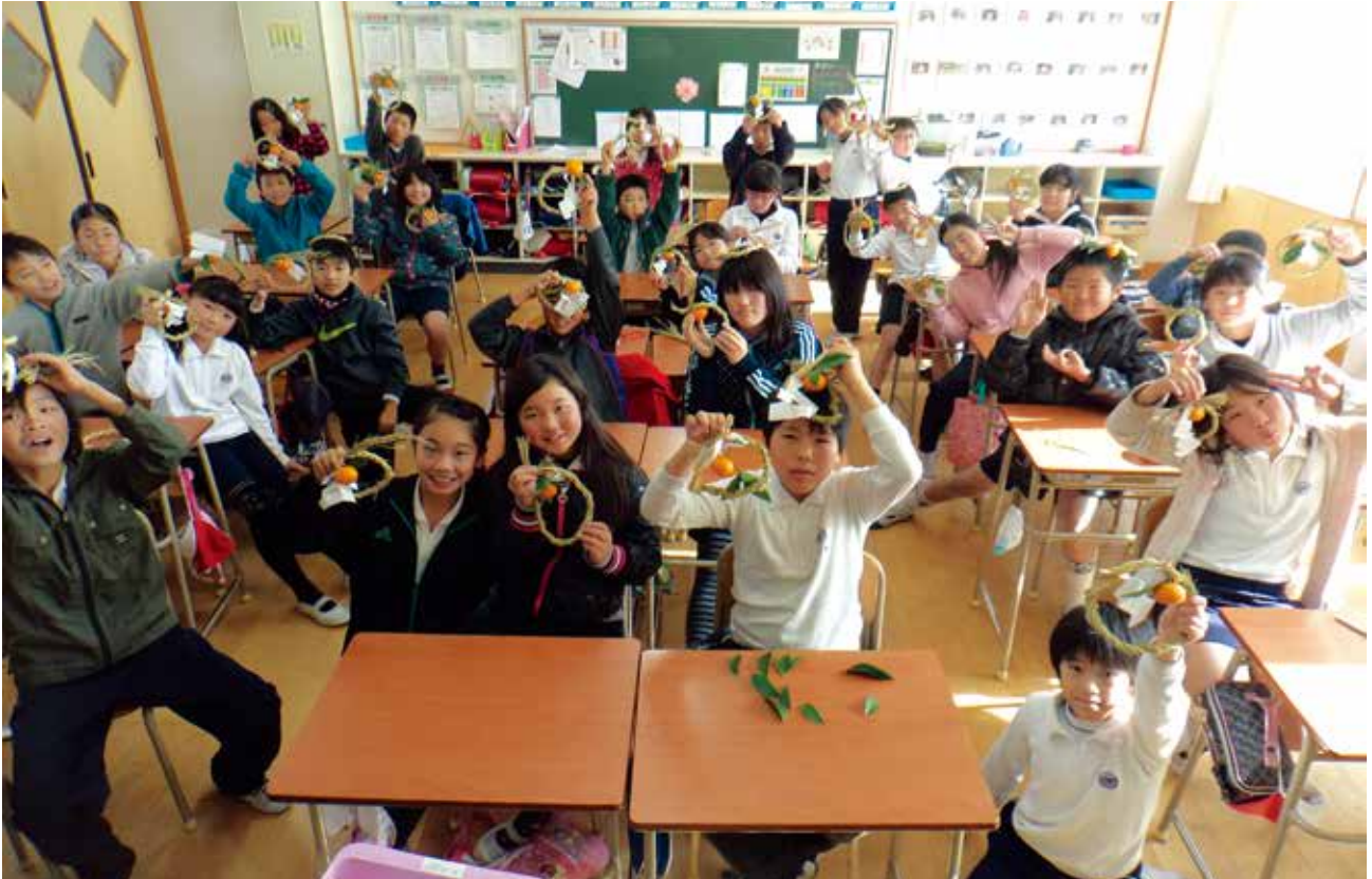
行橋小学校の5年生が行橋校区老人クラブ「讚寿会」のみなさんとしめ縄作りを行いました。