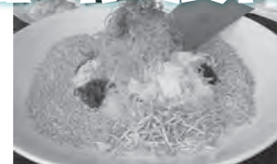
魚生はシンガポールの中国正月料理です。

今度の国際交流イベントは、年明けに開催するインターナショナル・ニューイヤー・パーティー！世界のさまざまな地域の外国人青年を招き、一緒に外国の料理を作ったり、ゲームやダンスをしたり、楽しい催しが盛りだくさんです！皆さん、お誘い合わせの上、ぜひご来場ください。一緒に盛り上がりましょう！