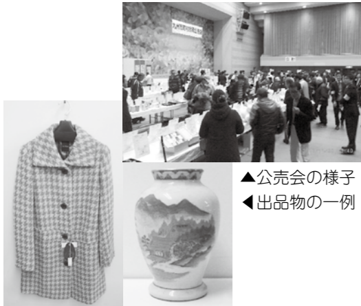
▲公売会の様子 ▼出品物の一例

公売とは... 市が国税徴収法などの法令に基づき、滞納者から差し押さえた財産を売却する手続きです。庁舎の掲示板などでお知らせした後、指定の公売会場で行います。参加者が入札書に金額などを記入して入札し、最高値を付けた方に公売財産を売却します。