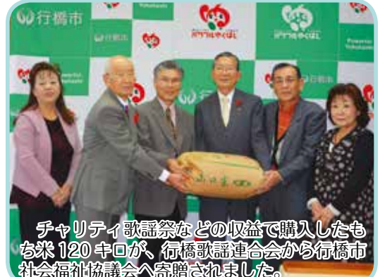
チャリティ歌謡祭などの収益で購入したもち米120キログラムが、行橋歌謡連合会から行橋市社会福祉協議会へ寄贈されました。

編集後記 「カンボン」はマレー語で「村落」という意味です。以前、多くのシンガポール人は、郊外の簡素な家々が集まった「カンボン」と呼ばれる集落に、中国系人もマレー系人も隣り合わせで暮らしていました。隣人はそれぞれ助け合い、子供たちは集まって外で遊び、戸に鍵をかけることもなく皆が行き来し、日々のんびり暮らしていました。その精神は「カンボンスピリット」と言われています。しかし、1965年から国民はほとんど高層住宅に引っ越し、「カンボン」はだんだん少なくなってきました。「カンボン」はなくなってきましたが、「カンボン」と「カンボンスピリット」という言葉は親しみを持たれ、今でもよく使われています。(シエリル)