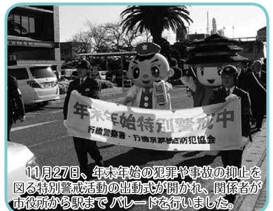
11月27日、年末年始の犯罪や事故の抑止を図る特別警戒活動の出動式が開かれ、関係者が市役所から駅までパレードを行いました。