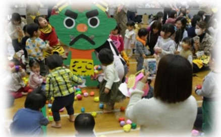
▲子育て支援センターの催し