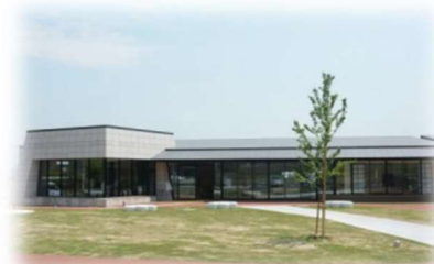
▲椿市地域交流センター(小さな拠点事業)

地域を支えあい、交流しあうまち ～時代に合った地域をつくり、 安心な暮らしを守るとともに地域と地域を連携する～