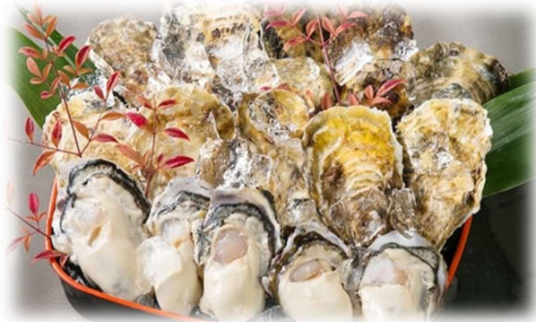
▲豊前海「一粒かき」(ブランド化の推進)

学びが仕事へ、仕事子どもたちの学びへつながるまち ～地方における安定した雇用を創出する～