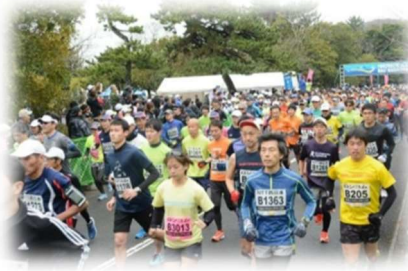
▲ゆくはしシーサイドハーフマラソン