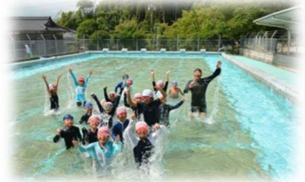
▲放課後児童クラブの風景